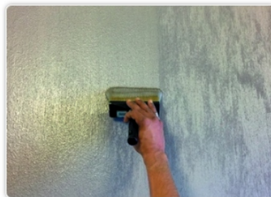
Stap 5 - Breng, indien gewenst, na een paar uur op een droge muur een tweede laag aan om het effect voller en homogener te maken, behoud de verticale richting van aanbrengen en teken FilidiSeta op de muur