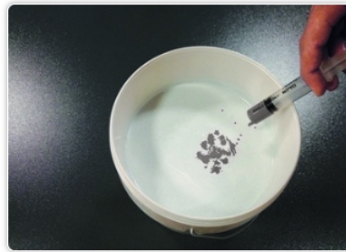
Stap 2 - Kleur indien nodig FilidiSeta in.