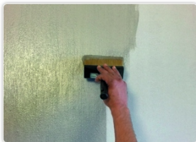
Stap 4 - Verdeel het product verticaal over de muur om het effect van FilidiSeta te behouden en te tekenen