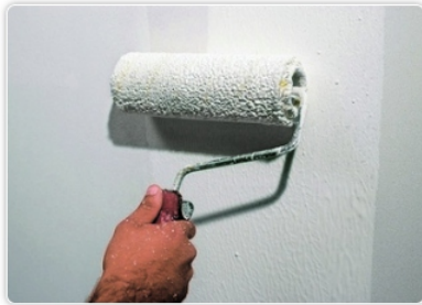
Stap 1 - Breng om te beginnen Primus Sabbia aan.

Opslag: op een droge, koele plaats, vrij van vorst en vochtigheid.