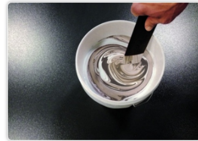
Stap 3 - Meng het product totdat het homogeen is.