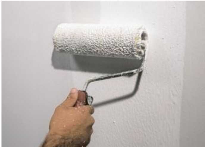
aanbrengen Primus Sabbia