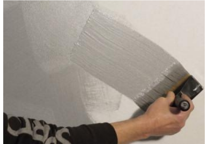
Minimal aanbrengen met blokwitter