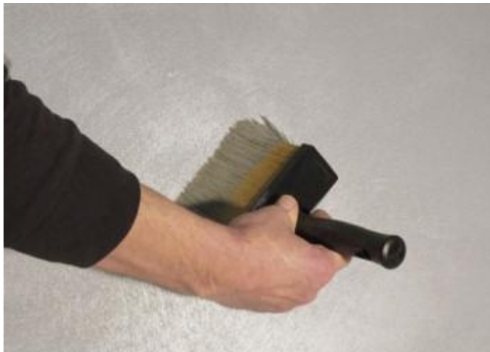
Na een paar minuten strijkt u het product met een schone blokwitter egaal