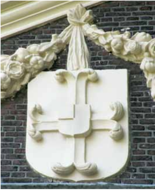
2 De groep opdrachtgevers van wapenschilders breidde zich in rap tempo uit. Wapen van burgemeester Willem Paedts, zeventiende eeuw.

Het woord 'huisschilder' bestond in de middeleeuwen niet. De term komt ook niet voor in de zeventiende- en achttiende-eeuwse Leidse archieven. Het schilderen van huizen werd 'kladschilderen' of 'grofschilderen' genoemd en ook daarvoor klopten men doorgaans aan bij de wapenschilder en schilder van uithangborden.