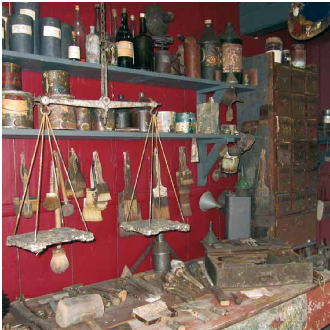
11 Schilderswerkplaats in het Openluchtmuseum Het Hoogeland in Warffum.

bandkwasten, Brabantse kwasten, platte daskwasten, ronde daskwasten, verguldpenselen, draadtrekkers, slegtkwasten, slagkwasten en houtkwasten. 37 Verder beschikte het schildersbedrijf over ladders, steigers, klampen, afbrandkorven en brandijzers om verf af te branden. Puimsteen en schuurpoeder was aanwezig voor schuurwerk. Op een lessenaar hield de schilder nauwkeurig de boekhouding bij en daar schreef hij ook de rekeningen voor zijn klanten uit. Tot omstreeks 1850 bewaarde men de aangemaakte verf in grote potten van hout of aardewerk. Naar