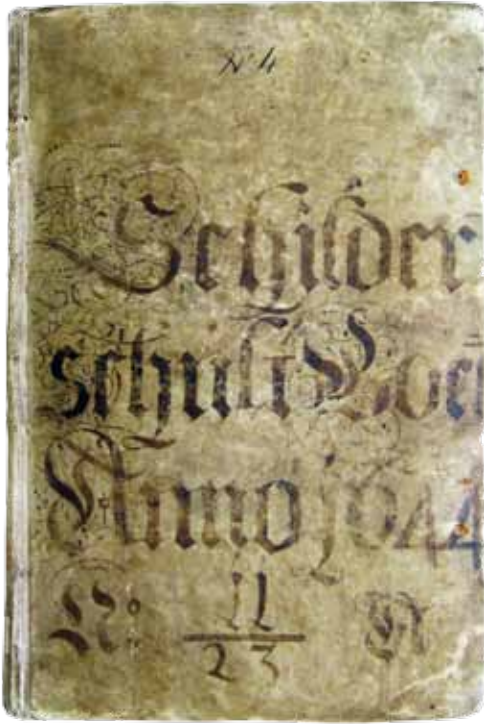
7 Schilderschriftboek van het Leidse St. Lucasgilde, 1644. Regionaal Archief Leiden.

mijn zoon in als leerling om te leere schildere Met de groote Kwast voor 4 jaar. Begint den 25 ijanniarij 1743 bij mijn'. 31