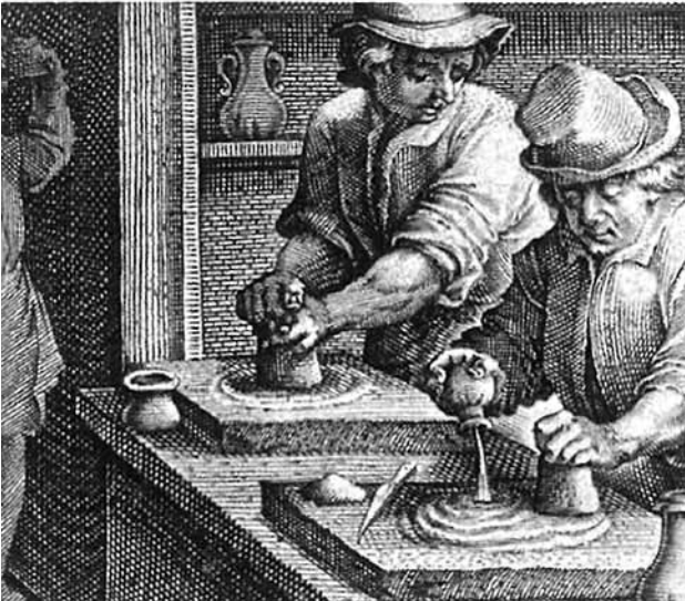
9 Verfmengers . Detail van de gravure 'Color Olivi' uit de serie Nova reperta ('Nieuwe ontdekkingen') van Johannes Stradanus (1523-1605), 1584.

Het moet een genot zijn geweest om in de werkplaats van een schilder te vertoeven: de heerlijke luchtjes van olie en terpentijn, het vertrouwde geluid van de schavende looper over de wrijfsteen, de zacht ratelende potmolen en de pruttelende lijnolie in de ketel op het turfvuur.