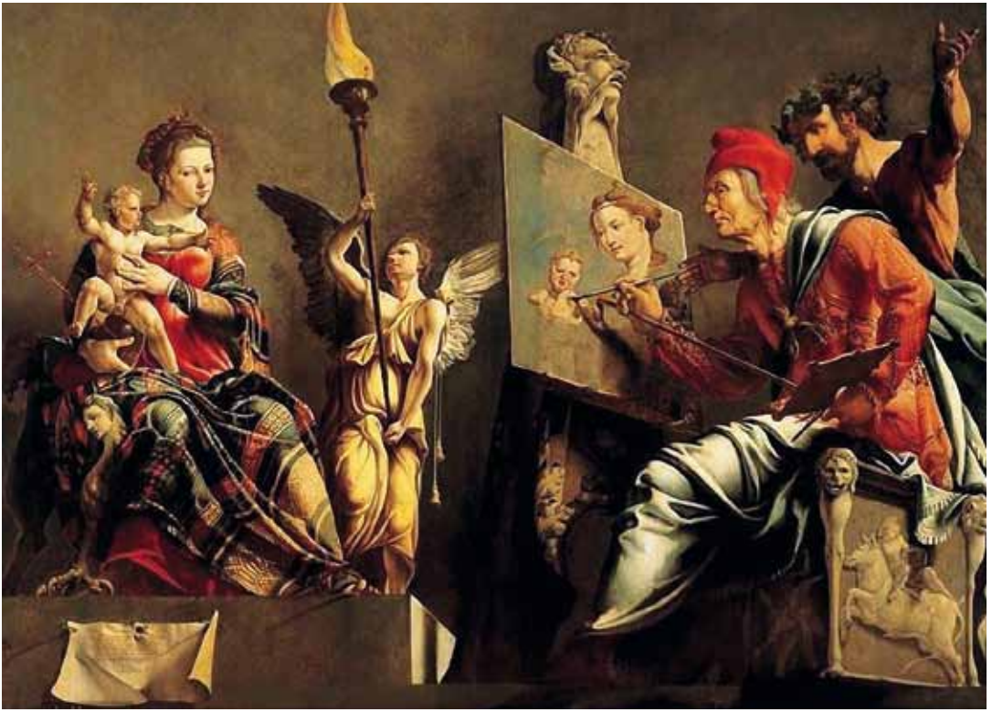
4 Maarten van Heemskerck (1498-1574), St. Lucas schildert Maria met Kind, Frans Halsmuseum.

hielden met leerbewerking. 12 Alle schilders, of het nu fijschilders waren of wapenschilders, waren wel verenigd in een eigen 'broedergenootschap'. Het laat zich raden dat zo'n genootschap een eigen wapen voerde. Dit wapen, een schild met daarop drie blanco schildjes, symboliseerde het vak van de schildmaker. 13 De schildjes zijn blanco om aan te geven dat de schildmaker ze, als het ware 'nog moest beschilderen'. Het getal drie werd gezien als heilig en volmaakt en verwijst waarschijnlijk naar de Heilige Drie-eenheid. In het leven van de leden van de middeleeuwse gilden en broedergenootschappen was het geloof een bepalend element. De meeste gilden en broedergenootschappen hadden dan ook een eigen kapel in een van de belangrijke kerken van een stad. Dat was ook het geval met het broedergenootschap van de Leidse schilders. Hun kapel bevond zich in de St. Pancratiuskerk, de huidige Hooglandse Kerk. De kapel was gewijd aan de beschermheilige van de schilders: St. Lucas. Volgens een legende uit de zesde eeuw