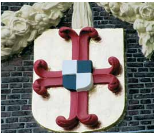
3 De kleuren van het wapen van Willem Paedts werden in 2010 teruggebracht. Geveltop van de achtergevel van het Sieboldhuis, Rapenburg 19.

Het woord 'huisschilder' bestond in de middeleeuwen niet. De term komt ook niet voor in de zeventiende- en achttiende-eeuwse Leidse archieven. Het schilderen van huizen werd 'kladschilderen' of 'grofschilderen' genoemd en ook daarvoor klopten men doorgaans aan bij de wapenschilder en schilder van uithangborden.